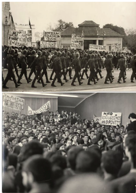
Figura 3 - Fotografias de 17 de abril: desfile militar e Assembleia na FaC Ciências

ao processo de sua atuação e posição” (NAMORADO, 1989 Anexo 8 p. 112 e 113)