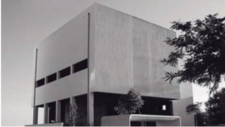
Figura 2 - Edifício-sede do CCAVANCA - em fase de construção -, futuramente o lugar de depósito do espólio

para o desenvolvimento de uma base de dados apta a receber a informação digitalizada até então, e, sobretudo, realizar sessões de exposição do espólio e do trabalho que está a ser estudado, de forma a captar a atenção e interesse de investigadores e académicos e das comunidades local e (trans)regional – escolhas motivadas pelas relações que o Eng.º Lavrador criou e manteve com as regiões Norte e Centro 2 .