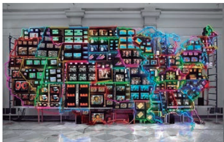
Figura 4 - Electronic Superhighway: Continental U.S., Alaska, Hawaii , Nam June Paik, 1995 (fonte: Smithsonian American Art Museum)

monitores de vídeo e projeções, exibindo imagens e sons ao vivo ou gravados. Entre os seus pioneiros destacam-se os nomes Nam June Paik, (Coreia do Sul, 1932) e Wolf Vostell (Alemanha, 1932), duas personalidades ligadas ao movimento Fluxus - termo cunhado pelo artista e teórico George Maciunas (Lituânia, 1931) -, corrente artística que juntou um grupo de artistas empenhados em desacreditar as instituições culturais que governavam o panorama artístico vigente. Baseando-se em movimentos anti-arte como o dadaísmo ou os ready-mades de Marcel Duchamp (1887, França), estes artistas conceberam obras subversivas e até irónicas que tinham o propósito premeditado de confundir o público com conteúdos deliberadamente herméticos, organizando amiudadamente performances ao vivo ou happenings que eram críticos das sociedades materialistas e consumistas (Meigh-Andrews 2014).