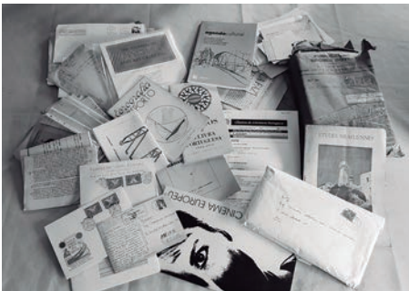
Figura 3 - Amostra de documentos referentes ao espólio

O ato de divulgação manifesta-se, portanto, como um elemento imperativo na formulação do projeto durante este seu primeiro ciclo de formação - a sua génese. Esta componente de divulgação tomará múltiplas formas, que por sua vez, poderão traduzir-se em conteúdos multidisciplinares e multifacetados. Para esclarecer o leitor sobre a variedade de resultados (hipotéticos) derivados da investigação do espólio, elenco as seguintes categorias de produção académica e artística propostas ao/pelo CCAVANCA: