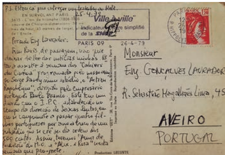
Figura 6 - Postal referente ao espólio de Fernando Gonçalves Lavrador

Este modelo de pesquisa sugere seis conceitos metodológicos - contiguidade, investigação vivida, metáfora e metonímia, aberturas, reverberações e excesso - que se destinam a operar como provisões para (re)escrever a pesquisa e a cultura que se manifestam nos cruzamentos entre o saber e o ser.