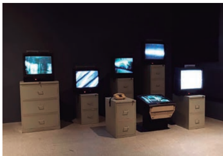
Figura 5 - 6 TV Dé-Collage , Wolf Vostell, 1963

Estes eventos presenciais destacam outra qualidade comumente associada à videoarte - a sua vertente transitória: