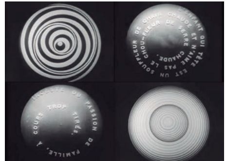
Figura 8 - Colagem de fotografamas do filme Anémic Cinema , Marcel Duchamp, 1926

Através da espiral – e de outras formas – procura-se (re)interpretar os textos escritos por e para Fernando Gonçalves Lavrador. Por fim, é importante conciliar estas imagens com o movimento - e daí resulta a produção em vídeo. Neste âmbito poderá ser ainda possível homenagear alguns dos artistas aqui citados, acrescentando uma nova dimensão às suas obras, convertendo o seu carácter estático em cinético – a título de exemplo serve como referência de inspiração o filme experimental dadaísta Anémic Cinema de Marcel Duchamp (ver figura 8).