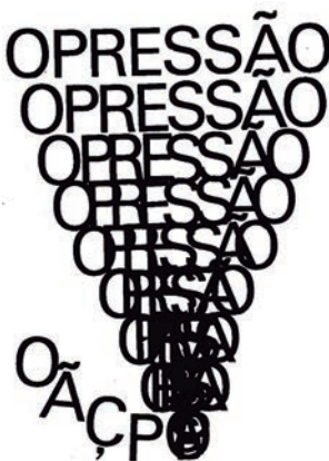
Figura 7 - Opressão , Alexandre O'Neill, 1972 (fonte: Arquivo digital da PO.EX)