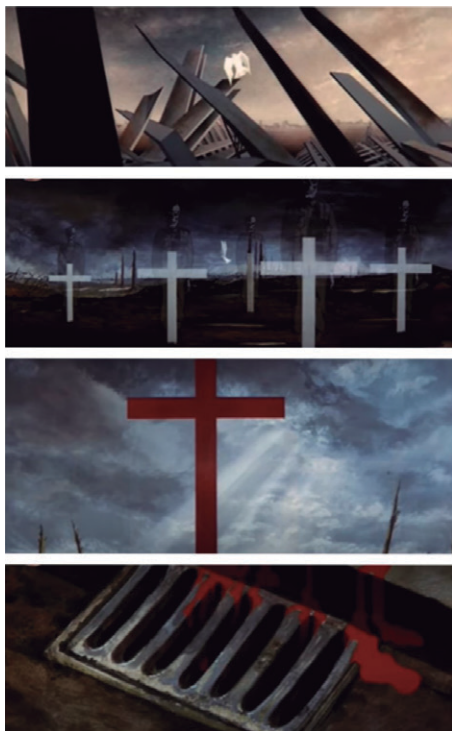
Figura 3 - Detalhe das sequências da animação para a canção "Goodby blue sky".

O horror da guerra é cantado e visualizado. Pomba, ave, avião e em seguida, as cruzes cobrem o céu (Figura 3). A morte se faz presente e o símbolo da pátria se desmancha. É a bandeira que se torna a imagem da cruz, encharcada de sangue inocente. Do céu, surge novamente a ave raiosa que se transforma, em meio as chamas, em destroços e ferros retorcidos.