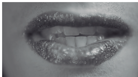
Imagem 6 – Plano detalhe em “A Reunião”.

O filme foi pensado para ser exibido em festivais e editais, e por isso, a sua produção segue alguns princípios básicos para garantir seu acesso a tais meios. Dentre elas está a escolha da filmagem em 4K, o investimento em microfones de lapela para garantir a qualidade da gravação de áudio.