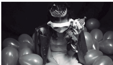
Imagem 10 – Detalhe de cena em “A Reunião” (acervo pessoal).