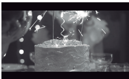
Imagem 7 – Detalhe de objeto cênico em “A Reunião”.