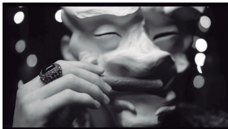
Imagem 9 – Detalhe de máscara em “A Reunião” (acervo pessoal).