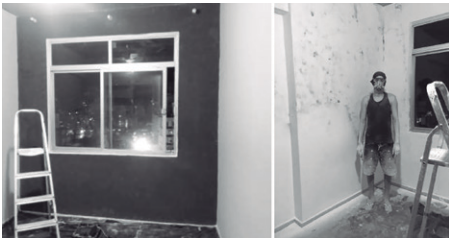
Imagem 4 – Home studio em construção.

Todo o roteiro precisou ser escrito e adaptado para acontecer no home studio do autor, evidenciando diversos limites para o processo criativo, ainda mais relevante durante a etapa de roteirização técnica e construção do documento misto de decupagem.