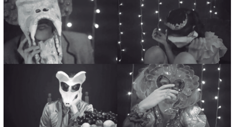
Imagem 5 – Cena com personagens reunidos em “ A Reunião ” (acervo pessoal).

psicológico, mutável, onde as cenas, memórias, cenários e personagens se desdobram. Os objetos de cena são, em sua maioria, móveis da casa do próprio autor e objetos pessoais porque, para além de viabilizar os custos de produção, remete ao processo artístico autoficcional em que os objetos de cena estão associados a memórias afetivas.