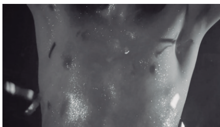
Imagem 8 – Detalhe de atuação em “A Reunião”.