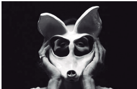
Imagem 3 – Teste de enquadramento da máscara da Raposa.

imagem pela qual prezamos e nos envergonhamos, mas proporcionam desconforto físico associado a seu uso, processo de materialização do peso simbólico que os papéis sociais exercem sobre o ser. O cuidado para evitar a quebra dos objetos é acompanhado de dores na testa, no caso da máscara da Raposa; baixa capacidade de visão, excesso de peso e volume no caso da máscara do Macaco; obstrução na circulação sanguínea na região da boca ao usar a máscara da Ave, e assim por diante.