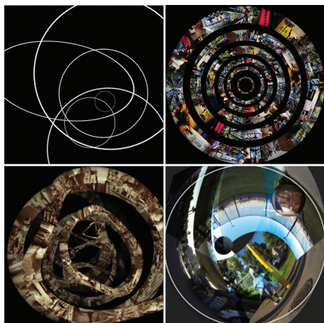
Figura 1 - Frames digitais da obra audiovisual “Monumentos Virtuais”, formato para exibição fulldome.

No segundo momento, surgem três “globos” (esferas) com vídeos dos locais do cotidiano das três cidades, um para Durban (vídeos de ruas e pontos de transportes coletivos), outro para Santa Maria (vídeos de estradas entre árvores e morros) e outro “globo” para Fortaleza (vídeos de dunas e praias). Estes “globos” se entrecruzam, tendo sua dimensão e temporalidade distorcida (duração 2:15 minutos).