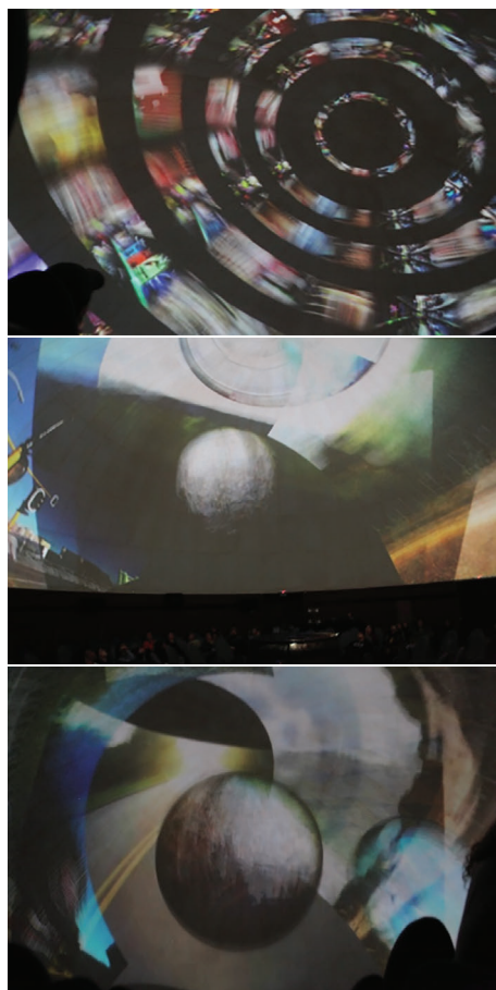
Figura 4 - Mostra "EFEMERA Imagem - Exibição Audiovisual Internacional Fulldome". Realizada em outubro de 2019 no Planetário da UFSM. Integrando a mostra "LabInter Arte - Memória – Tecnologia 2019".