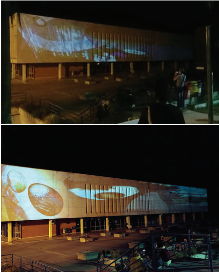
Figura 6 - Apresentação de “Monumentos Virtuais” no “Campus Open Mapping V.1”. Na Biblioteca Central da UFSM. No dia 13 de dezembro de 2019.

O trabalho ainda foi convidado para participar no evento no “Campus Open Mapping V.1” (organizado por Wagner Bento, com apoio do LabInter – Laboratório Interdisciplinar Interativo, do GAD – Grupo de Arte e Design, ambos do PPGART - Programa de Pós Graduação em Artes Visuais da UFSM). A exibição ocorreu na Biblioteca Central da UFSM, no dia 13 de dezembro de 2019.