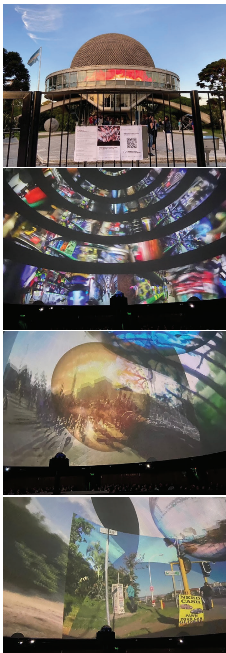
Figura 5 - Apresentação da obra "Monumentos Virtuais", no evento "Conciertos de Música Visual en Fulldome – UVM 2019", realizado no Planetário Galileu Galilei, no âmbito do "Festival Noviembre Electrónico", nos dias 21 a 28 de novembro de 2019. Buenos Aires, Argentina.