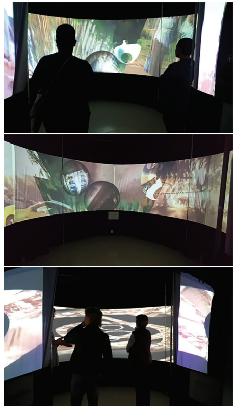
Figura 3 - Apresentação do trabalho "Monumentos Virtuais", como "Shared Virtual Monuments", na "DIGIFEST", setembro de 2019. Durban, África do Sul. Instituição promotora: University's City Campus.

Nessa ocasião, a equipe da África do Sul fez experimentos de projeção com uma tela panorâmica (em 360°) na "DIGIFEST", em Durban. Visando ativar espaços expositivos alternativos, temos apresentado trabalhos sobre o resultado do projeto em congressos e conferências nacionais e internacionais.