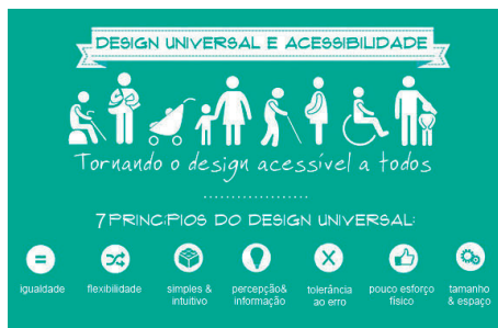
Sete Princípios do Design Universal.

Integrando os direitos humanos 12 a cultura revela-se indispensável na formação, servindo de alavanca para que o indivíduo se apoie nos conhecimentos adquiridos para experimentar o mundo, numa lógica inacabada de autoconhecimento. A pobreza cultural é considerada por alguns autores, a base das outras dimensões da pobreza (Costa, 2017). Sem identidade e sem autonomia, o indivíduo vê-se privado da sua liberdade para comunicar e exercer a sua cidadania.