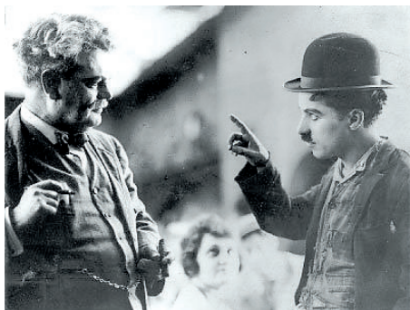
Granville Redmond e Charles Chaplin.

Mundial, e apesar de todo o sucesso conquistado, Redmond viu-se forçado a alterar o percurso por conta da precariedade da época. Talento mimico e comunicador viu no cinema uma extensão natural da sua personalidade tendo procurado Chaplin , que com 28 anos já registava uma carreira mundial.