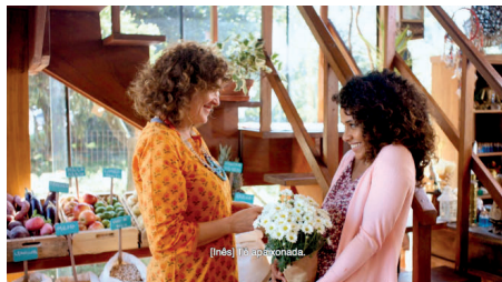
Exemplo de legendagem para Surdos e Ensurdidos.

É no processo de pós-produção de um filme que são inscritas as modalidades de tradução, através de recursos de acessibilidade como a Legendagem para Surdos e Ensurdidos (LSE) e a tradução em Língua Gestual (LG). Esta variação é importante pois a surdez determina-se em diferentes graus de profundidade: surdos congénitos têm como língua materna a Língua Gestual, sendo-lhes mais natural receber informação através de um intérprete do que da leitura numa língua secundária (Filmes que Voam, 2013). A LSE é uma tradução semelhante à legendagem para ouvintes, mas que traduz também outras informações: identifica os personagens e descreve efeitos sonoros. Em Portugal as orientações para LSE encontram-se descritas no “Guia de Boas Práticas – legendagem para surdos em programas gravados” concebido pela Entidade Reguladora para a Comunicação Social (ERC, 2018).