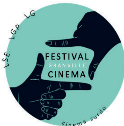
Exemplo de design de logótipo para Festival de Cinema Surdo Português.

Verificando-se a problemática do baixo volume de produção cinematográfica de Cinema Surdo, e consequentemente a fraca circulação dos conteúdos existentes, surge a proposta de um Festival de Cinema Surdo Português para colmatar as questões apresentadas. O festival dirige-se às escolas bilingue, associações de surdos, instituições com práticas de Língua Gestual Portuguesa (LGP) e estudantes do Ensino Superior nos cursos de LGP. É-lhes proposto a produção de metragens nas categorias de Animação, Ficção e Documentário com correspondência a pelo menos um dos seguintes critérios: utilizar a Língua Gestual como língua principal ou abordar a cultura surda. Em qualquer uma das escolhas os filmes deverão ser legendados de acordo com a necessidade (no caso de o filme ser em LGP legendar em Língua Portuguesa e vice-versa). O festival desdobra-se num ciclo de exibição de filmes a competição - aberto à comunidade - com premiação dos melhores trabalhos nas diversas categorias.