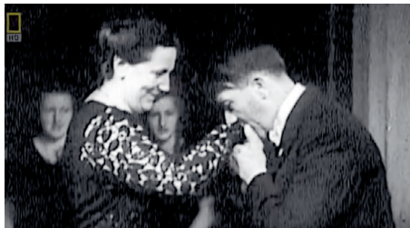
Figura 1. Winifred Wagner e Adolf Hitler

Beethoven teve um papel importante na formação musical de Wagner, mesmo sendo a música deste último destinada quase que exclusivamente ao gênero operístico. Em 1860, Wagner falou de sua convicção, na época, de que "a corrente vigorosa em que Beethoven havia transformado o fluxo da vida alemã poderia ser canalizada para o leito do drama musical" (Wagner apud Millington, 1995, 96). A identificação com a música de Beethoven se dá sobretudo pelo aspecto rítmico e pela estruturação formal, os princípios de organização e desenvolvimento de motivos, ampliando a ideia de melodia para a forma de uma composição contínua e coerente (Millington, 1995, 98). Por outro lado, Wagner terá um importante papel como propagador da obra de seu conterrâneo. No período de 1829-30, entre as peças originais do jovem Wagner há um arranjo para piano da Quinta Sinfonia. Posteriormente, já como renomado maestro, por diversas vezes interpretou obras de Beethoven, demonstrando especial predileção pelas Sétima e Nona sinfonias. Mas, se a música foi capaz de aproximar esses artistas, as posturas pessoais refletidas em suas posições ideológicas e políticas se mostram importantes argumentos para que fossem colocados em lados opostos durante a Segunda Guerra.