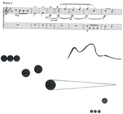
Figura 3. "O segundo tema traduzido em pontos" (Kandinsky, 1997, 39). 11

Kandinsky sempre demonstrou interesse por outras expressões artísticas, em especial pela música, e dessa visão universalizada das artes resulta uma crença na sinestesia, na possível correspondência entre sons, cores, imagens e perfumes. A geometria se introduziu em suas obras, e elementos como círculos, triângulos e quadrados passaram a dialogar em suas pinturas. Em 1926, ele publicou suas teorias estéticas em Ponto e linha na superfície , cuja primeira edição foi republicada um ano depois, sem nenhuma alteração, conforme consta no preâmbulo da segunda edição datado de janeiro de 1928 (Kandinsky, 1997).