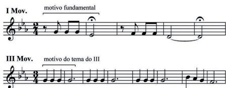
Figura 4. Motivos iniciais dos temas do I e do III movimentos da Quinta Sinfonia (Elaborada pela autora)

O tema do primeiro movimento da Quinta Sinfonia é conciso e diferente dos padrões da época. Constituído de três notas curtas e uma longa, ele se impõe desde o princípio, encabeçando como um mote, uma epígrafe, o conjunto do movimento. Ele será repetido de maneira obstinada e infatigável neste primeiro movimento da obra que se completa se completa em quatro movimentos: I. Allegro con brio – II. Andante con moto – III. Allegro – IV. Allegro